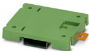
Abbildung zeigt die Variante EM-MP 45 N

Montageplatte, zum Aufschrauben von Schaltgeräten der Größe 0