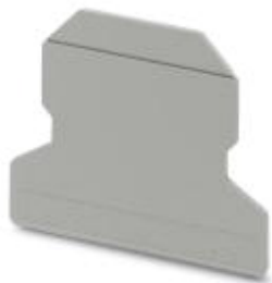
Abteilungstrennplatte, Länge: 56 mm, Breite: 1,5 mm, Höhe: 45,7 mm, Farbe: grau

Bitte beachten Sie, dass die hier angegebenen Daten dem Online-Katalog entnommen sind. Die vollständigen Informationen und Daten entnehmen Sie bitte der Anwenderdokumentation. Es gelten die Allgemeinen Nutzungsbedingungen für Internet-Downloads. ( http://phoenixcontact.de/download )