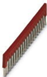
Steckbrücke, Rastermaß: 6,2 mm, Breite: 122,3 mm, Polzahl: 20, Farbe: rot

Bitte beachten Sie, dass die hier angegebenen Daten dem Online-Katalog entnommen sind. Die vollständigen Informationen und Daten entnehmen Sie bitte der Anwenderdokumentation. Es gelten die Allgemeinen Nutzungsbedingungen für Internet-Downloads. ( http://phoenixcontact.de/download )