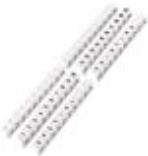
Bezeichnungsnagel-Zackband, bestellbar: streifenweise, weiß, beschriftet nach Kundenangaben, Montageart: Stecken, für Klemmenbreite: 5,2 mm, Schriftfeldgröße: 4 x 4 mm

Bezeichnungsnagel-Zackband - BN-ZB 5,2/WH CUS - 0824271