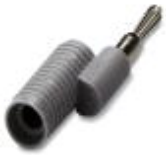
Reduzierstecker, Farbe: grau