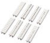
Zackband, bestellbar: streifenweise, weiß, beschriftet nach Kundenangaben, Montageart: Verrasten in hoher Schildchennut, für Klemmenbreite: 5,2 mm, Schriftfeldgröße: 5,15 x 10,5 mm

Zackband - ZB 5,LGS:FORTL.ZAHLEN - 1050017