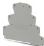
Abschlussdeckel, Länge: 99,5 mm, Breite: 2,2 mm, Höhe: 88 mm, Farbe: grau

Abschlussdeckel - D-PT 2,5-PE/3L - 3210543