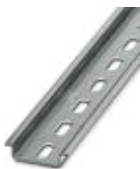
Tragschiene, Material: verzinkt, gelocht, Höhe 7,5 mm, Breite 35 mm, Länge: 2 m

Tragschiene gelocht - NS 35/ 7,5 ZN PERF 2000MM - 1206421