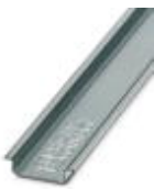
Tragschiene 35 mm (NS 35)

Tragschiene - NS 35/ 7,5 WH UNPERF 2000MM - 1204122