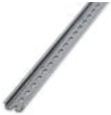
Tragschiene 35 mm (NS 35)

Tragschiene gelocht - NS 35/ 7,5 WH PERF 2000MM - 1204119