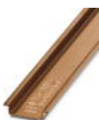
Tragschiene, Material: Kupfer, ungelocht, Höhe 7,5 mm, Breite 35 mm, Länge: 2 m

Tragschiene ungelocht - NS 35/ 7,5 CU UNPERF 2000MM - 0801762