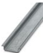
Tragschiene, Material: verzinkt, ungelocht, Höhe 7,5 mm, Breite 35 mm, Länge: 2 m

Tragschiene ungelocht - NS 35/ 7,5 ZN UNPERF 2000MM - 1206434