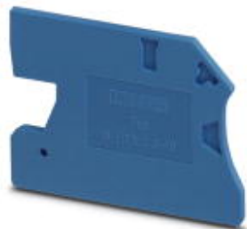
Deckel, für die Klemmen UTN 2,5, UTN 4, UTN 6, UTN 10

Bitte beachten Sie, dass die hier angegebenen Daten dem Online-Katalog entnommen sind. Die vollständigen Informationen und Daten entnehmen Sie bitte der Anwenderdokumentation. Es gelten die Allgemeinen Nutzungsbedingungen für Internet-Downloads. ( http://phoenixcontact.de/download )