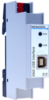
KNX USB Interface 312