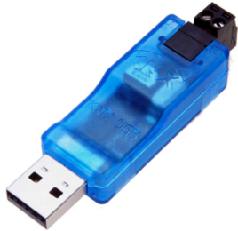
Foto des Geräts

Kompakte USB Schnittstelle zwischen PC und KNX-Bus